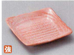
063-11-225 1,650円 赤楽正角皿 (17.5×3.5cm)