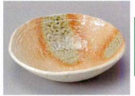
063-10-495 1,650円 オリベ吹平鉢 (17×4.2cm)