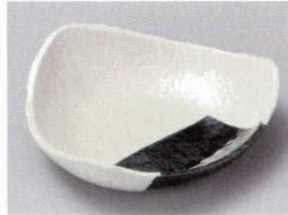
063-12-095 1,600円 おにぎり皿 (16.4×4.5cm)