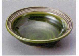
063-20-085 1,450円 織部ライン4.8鉢 (14.5×2.2cm)