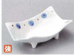
063-03-075 1,820円 二色水玉向付 (17.5×10.5×6cm)