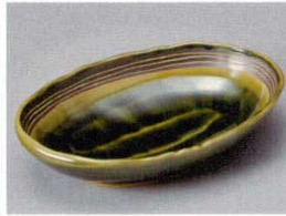
063-08-085 1,750円 織部ライン精円6.0鉢 (20.3×13.5×1.1cm)