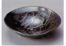
063-05-095 1,800円 黒釉三ツ足5.0鉢 (18.2×5.2cm)