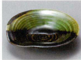
063-17-535 1,500円 天の川5.5浅鉢 (17.3×4cm)