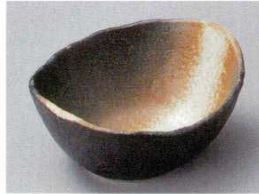
063-26-025 1,350円 いぶし備前 新精円深鉢(中) (16×13.5×7cm)