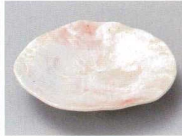
063-27-675 1,350円 桜志野三ツ足向付 (19.7×19×4cm)