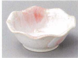
063-23-685 1,370円 桜志野花型5.0鉢 (15.5×6cm)