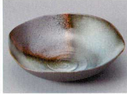
063-02-495 2,100円 森の湖平鉢 (18.5×5cm)