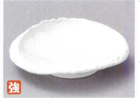
063-15-495 1,550円 ホワイトオーバル6.0向附 (18.5×17.5×4cm)