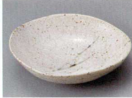
063-01-495 2,100円 オアシス平鉢 (18.5×5cm)