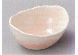
063-25-025 1,350円 桜志野 新精円深鉢(中) (16×13.5×7cm)