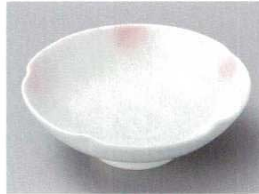
063-16-475 1,550円 ピンク吹京型高台向付 (14.4×4.5cm)