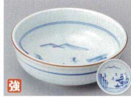
063-04-025 1,820円 (強) 測錆山水5.5丸鉢 (16×6cm)