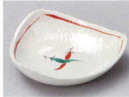
063-13-095 1,600円 粉引とうがらし三角鉢 (16.8×4.5cm)