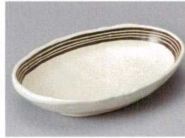
063-09-085 1,750円 志野ライン精円6.0鉢 (20.3×13.5×1.1cm)