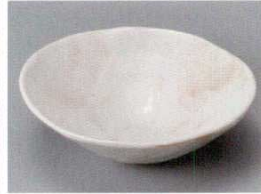
063-19-515 1,450円 赤志野円錐鉢大 (17.6×5.6cm)