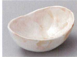
063-14-515 1,590円 赤志野玉子型鉢(大) (17.6×13.4×7.4cm)