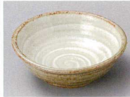
063-22-025 1,400円 石焼かいらぎ4.8丸鉢 (15×4.5cm)