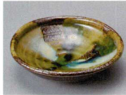
063-21-475 1,400円 鉄三彩5.0平鉢 (15×4cm)