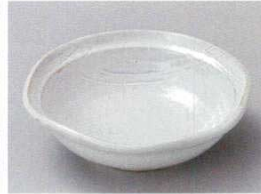
063-24-075 1,350円 白樺六角鉢 (14.7×14.3×4.5cm)