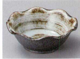
063-29-685 1,350円 白刷毛花型5.0鉢 (15.5×6cm)