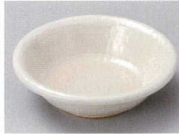
063-18-025 1,470円 荒土御本手 5.5鉢 (16×5cm)