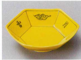
063-07-475 1,750円 黄釉雪月花六角間取向付 (15×14×4.3cm)