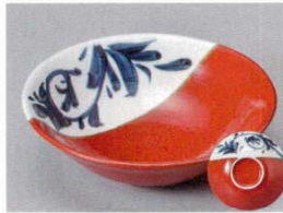
063-06-495 1,800円 赤結晶唐草向付 (16.2×5cm)