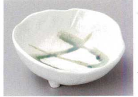
063-30-525 1,300円 白マット織部散し三ツ足向付 (14.2×5.3cm)