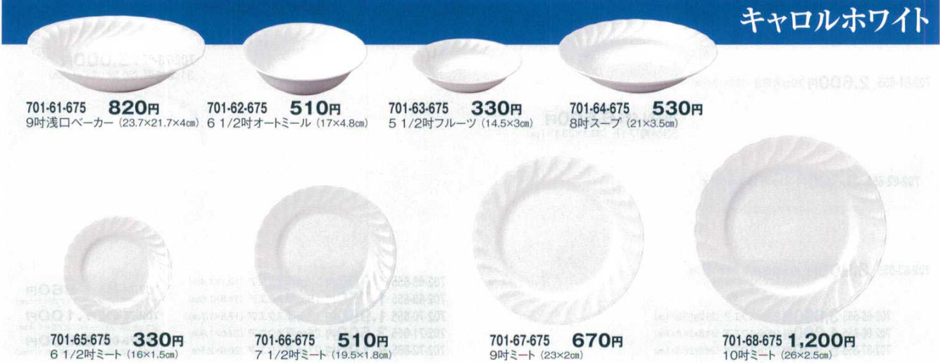
701-61-675 820円 9吋浅口バーカー (23.7×21.7×4cm)