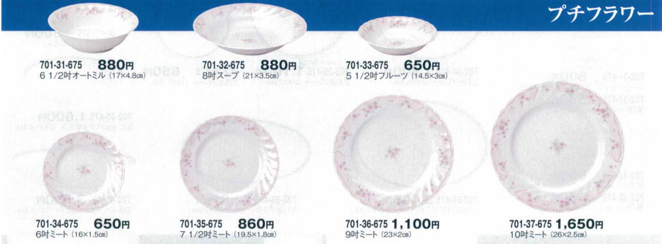
701-31-675 880円 6 1/2吋オートミール (17×4.8cm)