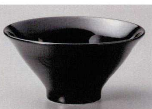
777-06-655 2,100円 黒 6.5薄筋6.5薄筋高ハマ丼 (20×10cm)