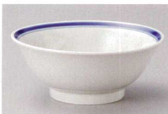
777-18-655 1,930円 紺線7.0反高台丼 (21.6×8.7cm)