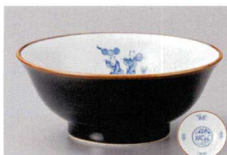
777-09-645 2,000円 天目唐子6.8反高台丼 (21×8.5cm・1310cc)