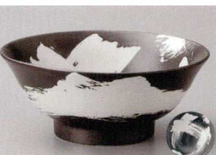
777-14-495 1,650円 黒檀7.0寸反丼 (21.7×9cm・1400cc)