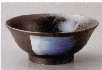
777-23-545 1,450円 黒釉刷毛6.8丼 (21.2×9cm)