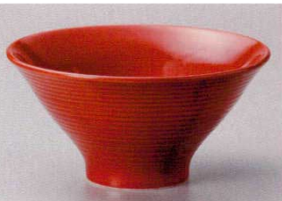
777-02-655 2,640円 千段 朱6.5千段高ハマ丼 (20×10cm)