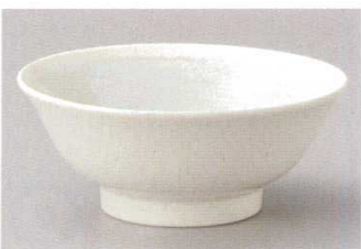
777-24-545 1,450円 粉引刷毛6.8丼 (21.2×9cm)