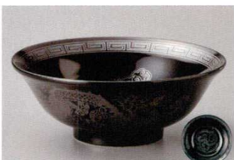
777-15-515 1,600円 黒釉銀竜紋6.8浅高台丼 (20.5×7.7cm) 777-16-515 1,400円 黒釉銀竜紋6.5浅高台丼 (19.5×7.3cm)