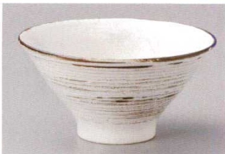
777-04-655 2,310円 錆粉引6.5千段高ハマ丼 (20×10cm)