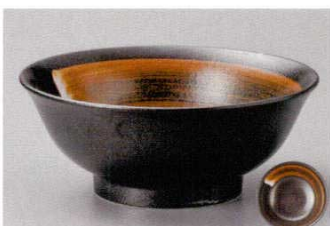
777-11-495 1,880円 黒潮7.0寸反丼 (21.3×8.7cm・1400cc)