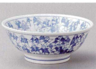
777-10-645 2,000円 百人唐子6.8反高台丼 (21×8.5cm・1310cc)