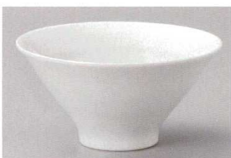
777-07-655 2,100円 白 6.5薄筋6.5薄筋高ハマ丼 (20×10cm)