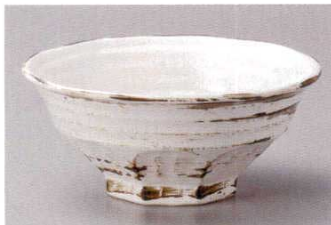
777-01-655 2,640円 錆粉引7.0長浜丼 (21.2×9.2cm)