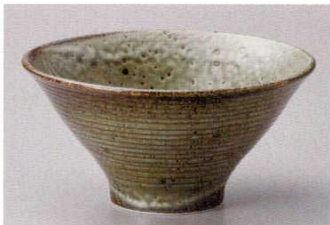
777-03-655 2,310円 わび うぐいす6.5千段高ハマ丼 (20×10cm)