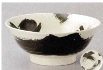
777-13-495 1,650円 白檀7.0寸反丼 (21.7×9cm・1400cc)