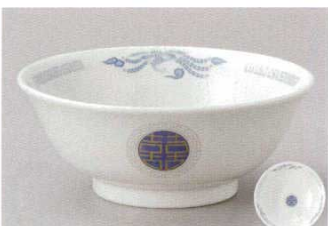
777-17-495 1,500円 新北京6.8高台丼(青) (21×8.3cm・1300cc)