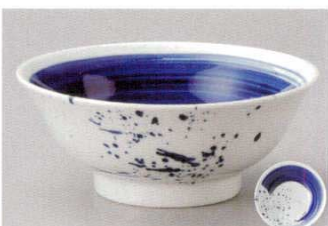
777-12-495 1,650円 海流7.0寸反丼 (21.7×9cm・1400cc)