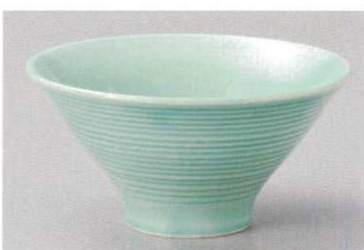
777-08-655 2,100円 トルコ青磁6.5千段高ハマ丼 (20×10cm)