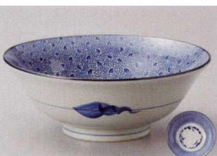
777-19-655 1,600円 紺線6.5反高台丼 (20.2×8cm)