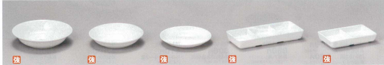
784-21-545 440円 超白1.4cmメタ深皿 (13.9×3.2cm) 784-22-545 430円 超白1.2cmメタ深皿 (12.5×2.9cm) 784-24-545 450円 超白1.2cmメタ皿 (11.9×1.8cm) 784-26-545 1,500円 超白スタック三品皿 (17×7.3×2.6cm) 784-27-545 1,100円 超白スタック二品皿 (11.7×7×2.5cm)