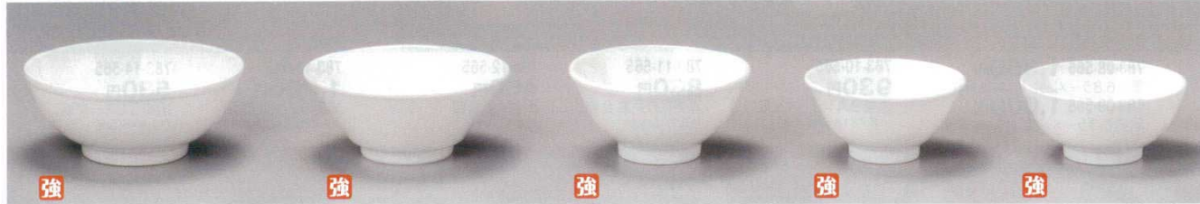
784-16-545 950円 超白5.0玉井 (15.2×6.4cm・600cc) 784-17-545 740円 超白1.4cmリムライス碗 (14.3×6cm・370cc) 784-18-545 650円 超白1.3cm反スープ碗 (12.7×6.3cm・330cc) 784-19-545 550円 超白1.1cm反スープ碗 (11.2×5.6cm・250cc) 784-20-545 600円 超白1.1cm丸ライス碗 (11.5×5.4cm・260cc)