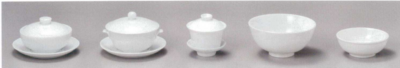
784-01-675 1,740円 UW中華手無フカヒレ 組 (11.6×7.4cm・200cc) 784-04-675 2,010円 UW中華手付フカヒレ 組 (11.8×9.4cm・200cc) 784-07-685 2,240円 茶釜(台皿付)(YUW) (9.4×9.4cm・160cc) 784-08-685 900円 台湾ラーメン丼 (15.5×7.3cm) 784-09-685 480円 3.8玉井 (11.8×4.3cm)