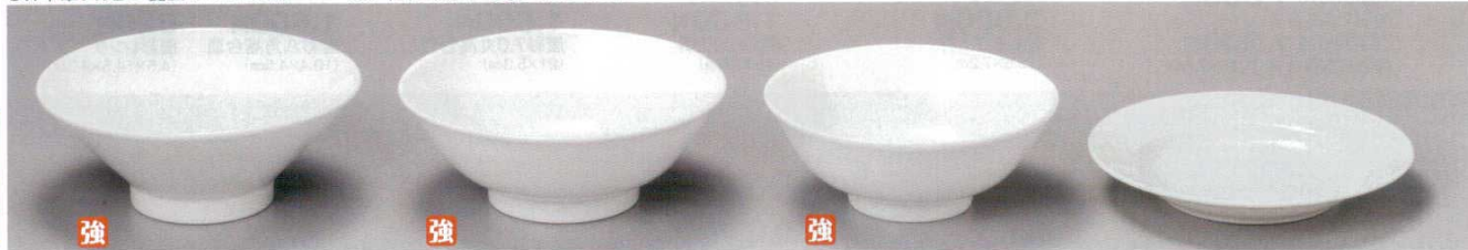
784-10-545 1,350円 超白21cm切立高台丼 (21×8.8cm・1150cc) 784-12-545 1,350円 超白7.0高台丼 (20.9×8.2cm・1250cc) 784-14-545 1,100円 超白6.5高台丼 (19×7.5cm・970cc) 784-15-675 600円 YZ21cm井受皿 (21×3.5cm)