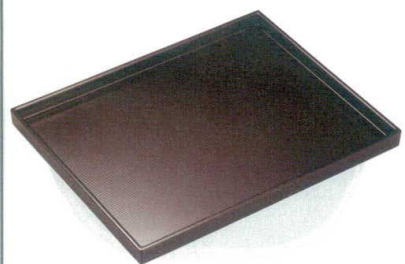
⑮ A 尺0寸千筋カスター盆 溜 B-31-60 ¥1,250 (30×24×2.2) 梱50