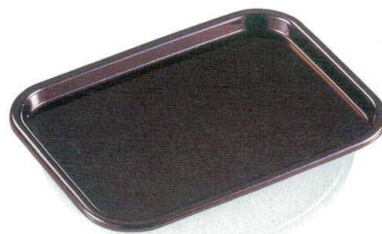
⑪ A 8寸長手サントレー 茶パール B-8-64 ¥800 (24×17.8×1.5) 梱60