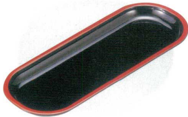
⑥ M D.X小判カスター盆 黒天朱 1-104-3 ¥900 (25.2×9.6×1.6) 梱100