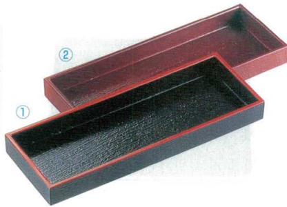
① A 新カスター盆 黒木目天朱 1-104-1 ¥950 (23.2×8.6×2.7) 梱100 ② A 新カスター盆 溜木目 B-8-63 ¥1,150 (23.2×8.6×2.7) 梱100