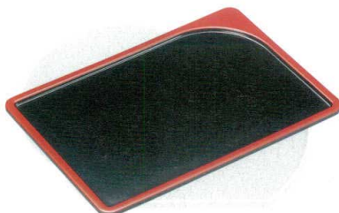
⑬ A 9寸袖型卓上盆 黒天朱 B-16-32 ¥1,550 (25.9×18.4×1.1) 梱60