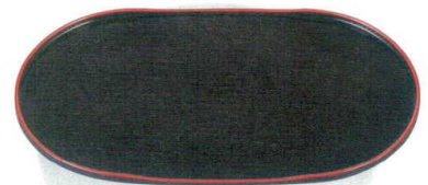
⑧ A 8.5寸小判千筋盆 黒天朱 1-102-8 ¥730 (25.5×15.3×1) 梱100 ⑨ A 尺0寸小判千筋盆 黒天朱 1-102-9 ¥930 (30.2×18.2×1) 梱80