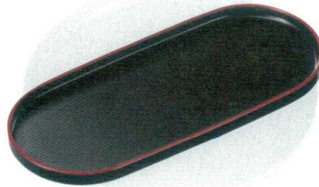
⑦ M 7寸小判千筋珍珠味盆 黒天朱 B-12-53 ¥1,050 (21×9×1.3) 梱100