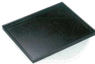
⑭ A 尺0寸千筋カスター盆 黒 B-31-59 ¥1,000 (30×24×2.2) 梱50