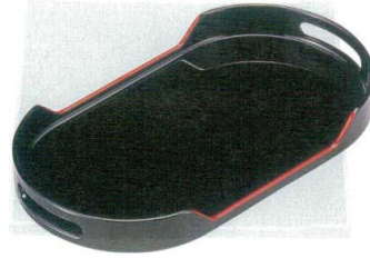
③ A 小判カスター盆 黒天朱 1-104-2 ¥900 (23×13×2.5) 梱100