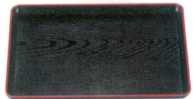
⑫ A 9寸しるこ盆 黒天朱 1-103-1 ¥1,000 (26×19×1.6) 梱100