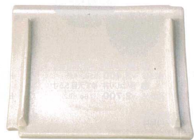
⑥ H-94-67 陶 瓦皿 白ラスター ¥4,200 (20.5×20.5×3.5)