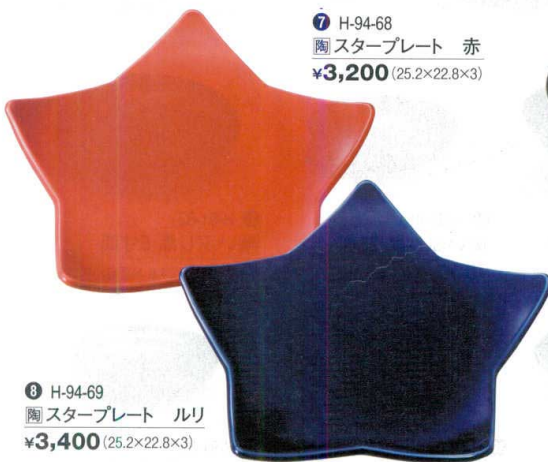
⑦ H-94-68 陶 スタープレート 赤 ¥3,200 (25.2×22.8×3)