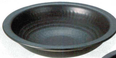
⑨ H-94-70 陶 (耐熱) 打出風土鍋 黒(小) ¥5,350 (23.5φ×6)