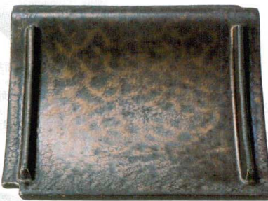
⑤ H-94-66 陶 瓦皿 金結晶 ¥4,000 (20.5×20.5×3.5)