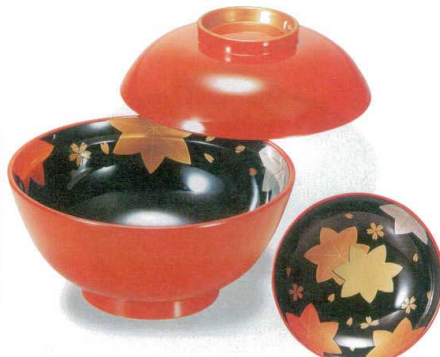
⑤ M 4.5寸煮物椀 朱ツバ金見返春秋 1-200-7 ¥4,450 (13.3φ×9) 楕100 310cc 225g