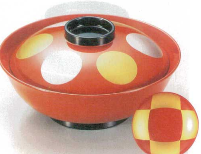
⑫ TM 4.5寸平駒椀 朱内朱日月見返市松 W-6-82 ¥4,450 (13.4φ×6.8) 楕100 220cc 175g