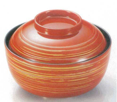
⑧ TM 4寸きさらぎ椀 朱かすり W-6-80 ¥3,200 (12.6φ×8.8) 楕100 380cc 175g