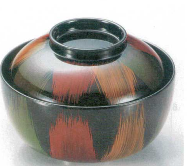
⑨ TM 4寸きさらぎ椀 新歌舞伎 W-6-81 ¥4,250 (12.6φ×8.8) 楕100 380cc 175g