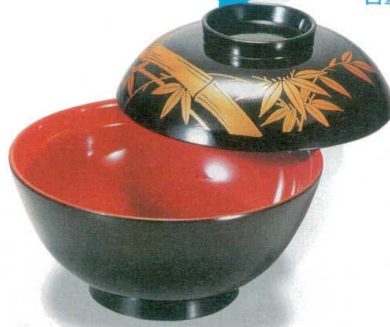
② M 4.5寸煮物椀 竹内朱 1-200-4 ¥2,900 (13.3φ×9) 楕100 310cc 225g