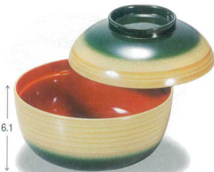
⑦ TM 4寸きさらぎ椀 白木かすみ内朱 1-199-9 ¥2,700 (12.6φ×8.8) 楕100 380cc 175g