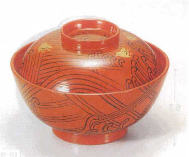
⑥ M 4.5寸煮物椀 朱刷毛目波千鳥内朱 S-H塗 1-200-10 ¥6,800 (13.3φ×9) 楕100 310cc 225g