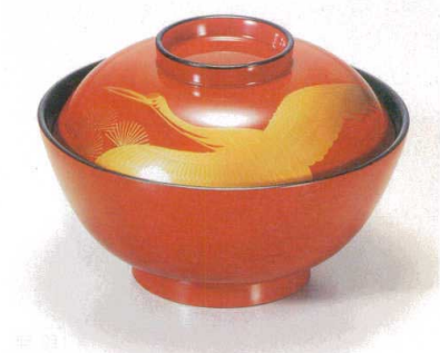
④ M 4.5寸煮物椀 後藤塗鶴松 1-200-5 ¥3,400 (13.3φ×9) 楕100 310cc 225g