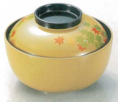
⑩ TM 4寸きさらぎ椀 変わり紅葉 W-3-73 ¥4,600 (12.6φ×8.8) 楕100 380cc 175g