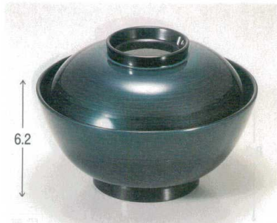
① M 4.5寸煮物椀 ブルー玉虫色 1-200-1 ¥2,450 (13.3φ×9) 楕100 310cc 225g