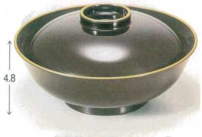
⑪ TM 4.5寸平駒椀 溜天金 1-203-1 ¥2,950 (13.4φ×6.8) 楕100 220cc 157g