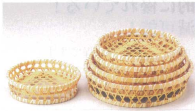
竹高台オードブル 直送