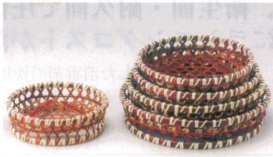
竹高台茜オードブル 直送