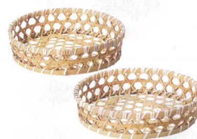
竹晒竹オードブルA型