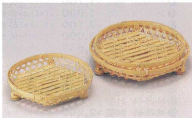
竹晒竹オードブル