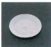
⑭ 1-756-4 丸アイスプレート 10φ ¥500 (10φ) 梱400