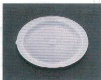
⑯ 1-756-6 丸アイスプレート 13φ ¥650 (13φ) 梱250