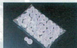
㉒ 1-756-16 ひょうたんアイス (25入×40袋入) ¥60,000 (5.5×3)