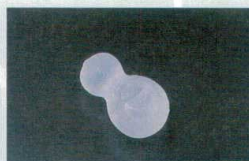
㉑ 1-756-15 ひょうたんアイス (1500バラ入) ¥80,000 (5.5×3)