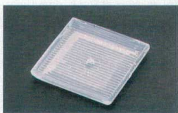
⑲ 1-756-8 角皿アイスプレート ¥700 (11×11×1.5) 梱200