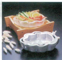
④ 1-756-18 氷鉢 木の葉型製氷器(盛器別売) ¥13,250 (23.5×17×6.5) (出来水 15.5×21×5) ⑤ 1-756-24 木(小)白木舟型盛込器 ¥7,000 (30×21.5×7)