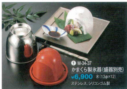
① M-34-37 かまぐら製氷器(盛器別売) ¥6,900 水(13φ×12) ステンレス、シリコンゴム製

■製氷器に水を入れて、冷凍室にて凍らせて下さい(10～12時間)。冷凍室より取り出して、室温にて放置し、表面に付いた霜が溶けてから取り出して下さい。