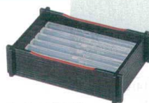
(小)アイスペール(スノ子白)