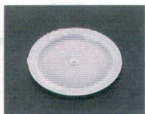
⑮ 1-756-5 丸アイスプレート 12φ ¥600 (12φ) 梱250