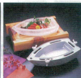
⑥ 1-756-19 氷鉢 舟型製氷器(盛器別売) ¥13,250 (28×15.2×5.5) (出来水 24.5×13.5×5) ⑦ 1-756-25 木ひの木井桁盛器 ¥14,000 (29×21.2×7)