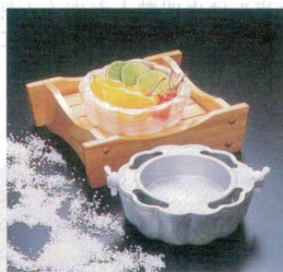
② 1-756-17 氷鉢 菊型製氷器(盛器別売) ¥12,900 (18.5×18.5×6) (出来水 φ15×4.5) ③ 1-756-24 木(小)白木舟型盛込器 ¥7,000 (30×21.5×7)