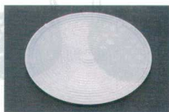
⑰ 1-756-7 丸アイスプレート 18φ ¥1,000 (18φ) 梱100