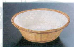
⑱ S-7-92 15cmアイスサラダボール(ザル付) ¥1,400 (17.3φ×5.5) 限定品