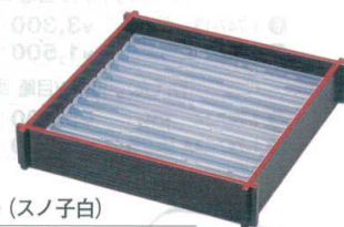
(大)アイスペール(スノ子白)