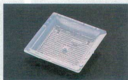
⑳ 1-756-9 角鉢アイスプレート ¥700 (11×11×3.1) 梱200