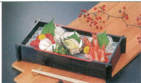
(中)アイスペール(スノ子白)