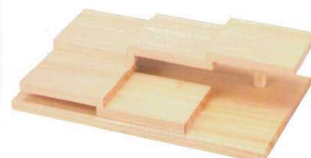
⑮ M-38-99 木 長角5連段盛(角) ¥12,600 (32.3×19×7.5) (目皿サイズ11×9.5×1.5)