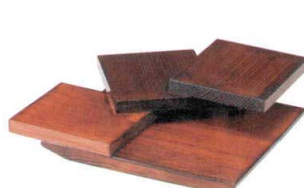
⑤ M-34-7 木 三段盛 茶 ¥8,000 (25×23×5.5) (目皿サイズ11×10) 柵15