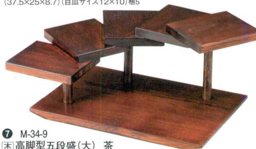
⑦ M-34-9 木 高脚型五段盛(大) 茶 ¥18,000 (37.5×26×14.5) (目皿サイズ12×10) 柵5