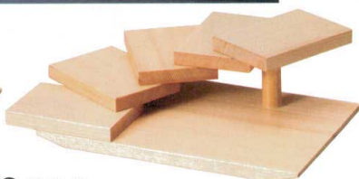
③ M-25-17 木 五段盛(小) ¥9,100 (27.5×19.5×8.3) (目皿サイズ10.5×7) 柵10