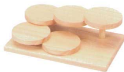
⑨ M-38-94 木 ミニ長角5連段盛(丸) ¥11,250 (25.5×16×8) (目皿サイズ9.2φ×1.5)