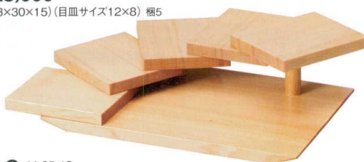
④ M-25-18 木 五段盛(大) ¥12,400 (37.5×25×8.7) (目皿サイズ12×10) 柵5