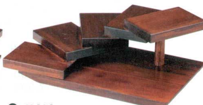
⑥ M-34-8 木 五段盛(小) 茶 ¥9,200 (27.5×19.5×8.3) (目皿サイズ10.5×7) 柵10