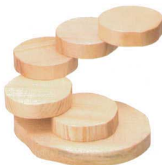
⑬ M-35-17 木 変形五段盛 丸 ¥17,000 (31×30×18.5) (目皿サイズ12φ×3) 柵5