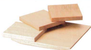
② M-25-16 木 三段盛 ¥7,500 (25×23×5.5) (目皿サイズ11×10) 柵15