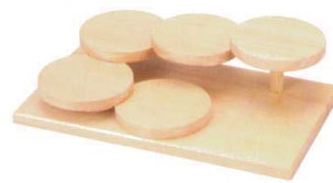
⑩ M-38-95 木 長角5連段盛(丸) ¥12,600 (32.3×19×8.2) (目皿サイズ10.5φ×1.5)