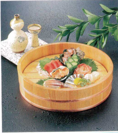
タガが抜けない新工法 (PAT)