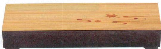
⑨ A 1段大寿弁当 木蓋 波春秋 溜内朱(3ツ仕切) ¥5,100 (37.5×13.5×6) 櫃40