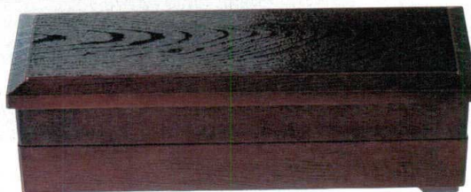
⑩ A 大寿弁当 溜内朱 1段(3ツ仕切) ¥2,300 (37.5×13.5×6.5) 櫃40 2段(3ツ仕切+タレ付セット) ¥3,650 (37.5×13.5×11.5) 櫃20