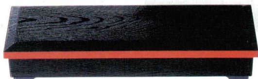
① A 1段大寿弁当 黒瀧朱(3ツ仕切) ¥2,000 (37.5×13.5×6.5) 櫃40