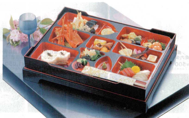
写真イメージは御膳干筋松花堂です。