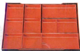
⑤ 尺7寸長手干筋松花堂用 多用仕切5点セット(5つ別々になります) (643-7, 8, 9, 10, 11を使用) ¥4,650