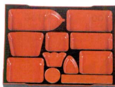
④ 1-249-1 [A]尺7寸長手干筋松花堂用 D.X仕切 朱天黒(1枚仕切) ¥4,300 (47.2×35.6×3.7) 梱15