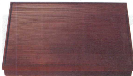
③ [A]尺7寸長手干筋会席松花堂 1-250-3 溜内黒塗(仕切別)(強化ABS) ¥8,400 (50×37.8×7) 梱10