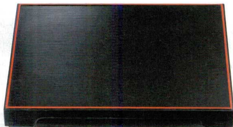
① [A]尺7寸長手御膳干筋松花堂 1-248-6 黒天朱内黒塗(仕切別)(強化ABS) ¥8,350 (50.5×38.5×7) 梱10