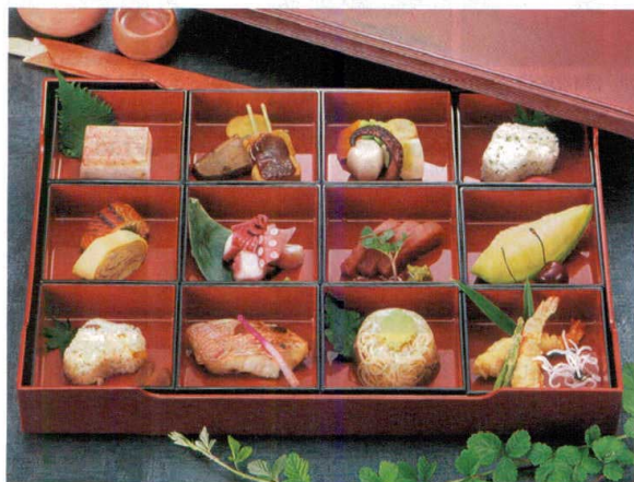
⑫ 尺7寸長手干筋会席松花堂用12点仕切 ¥7,200 (50×37.8×7) 梱10 (643-6を12分使用)