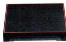
11 1-241-6 A 尺1寸長手御膳千筋松花堂 黒天朱(仕切別) ¥2,850 (31.3×26×7) 梱20