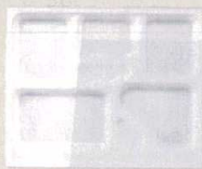
14 F-2-68 P.S/W-6 尺2寸長手 P.S白仕切 1ヶ ¥85 梱800