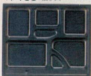
15 1-451-9 P.S/W-6 尺2寸長手 P.S黒仕切 1ヶ ¥85 梱800