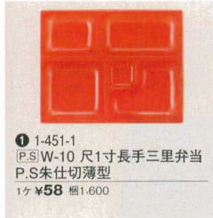
1 1-451-1 P.S/W-10 尺1寸長手三里弁当 P.S朱仕切薄型 1ヶ ¥58 梱1,600