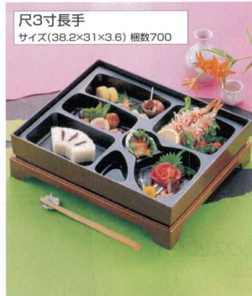
尺3寸長手 サイズ(38.2×31×3.6) 梱数700