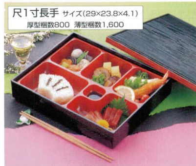
尺1寸長手 サイズ(29×23.8×4.1) 厚型梱数800 薄型梱数1,600