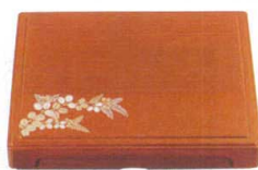
16 1-347-2 A 尺2寸千筋箱膳 梨地萩(仕切別) ¥4,050 (36×30×6.3) 梱20