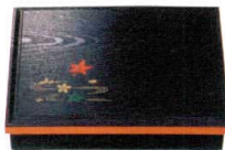
10 1-240-6 A 尺1寸長手木目松花堂 黒測朱春秋(仕切別) ¥3,150 (31.5×26×7) 梱20