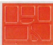
13 1-451-8 P.S/W-6 尺2寸長手 P.S朱仕切 1ヶ ¥85 梱800