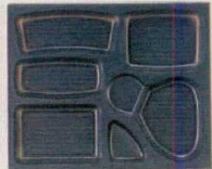
19 1-451-12 P.S/W-7 尺3寸長手 P.S 黒仕切 1ヶ ¥99 梱700