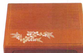
20 1-346-2 A 尺3寸千筋箱膳 梨地萩(仕切別) ¥5,250 (40×33×6.7) 梱10