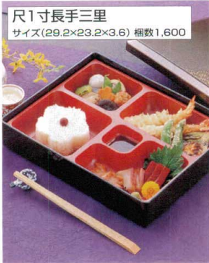
尺1寸長手三里 サイズ(29.2×23.2×3.6) 梱数1,600