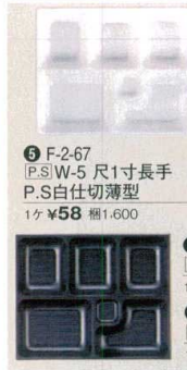
5 F-2-67 P.S/W-5 尺1寸長手 P.S白仕切薄型 1ヶ ¥58 梱1,600