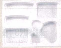
18 F-2-75 P.S/W-7 尺3寸長手 P.S白仕切 1ヶ ¥99 梱700