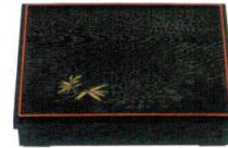
12 1-367-1 A 新尺1寸長手松花堂 黒天朱笹(仕切別) ¥2,900 (31.3×26×6.8) 梱20