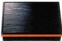
9 1-240-5 A 尺1寸長手ヘギ目松花堂 黒測朱(仕切別) ¥2,450 (31.3×26×6.8) 梱20