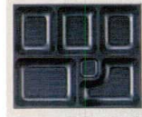
7 F-3-77 P.S/W-5 尺1寸長手 P.S黒仕切薄型 1ヶ ¥58 梱1,600 8 1-451-5 P.S/W-5 尺1寸長手 P.S黒仕切厚型 1ヶ ¥102 梱800