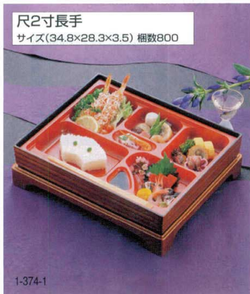
尺2寸長手 サイズ(34.8×28.3×3.5) 梱数800