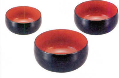
⑩ A 太鼓鉢 黒刷毛目内朱