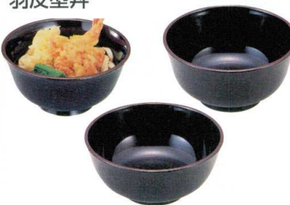
⑦ A 羽反型丼 黒天うるみ