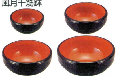
② A 風月千筋鉢 黒内朱