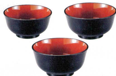
⑨ A 羽反型丼 黒刷毛目内朱