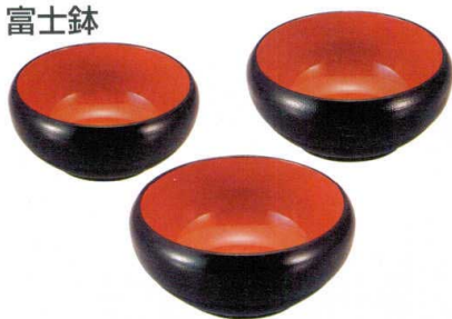
① A 富士鉢 黒刷毛目内朱