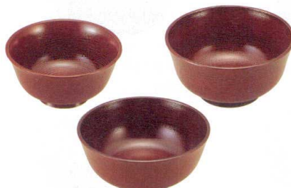
⑧ A 羽反型丼 内外溜刷毛目