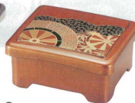
⑪ 1-572-8 A 象足井重 (爪脚付) 梨地御所車内朱塗 ¥1,900 (16.8×14.3×7.6) 柵60