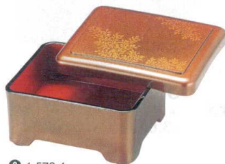
⑧ 1-572-4 A 象足井重 (爪脚付) 梨地シダ内朱塗 ¥1,750 (16.8×14.3×7.6) 柵60