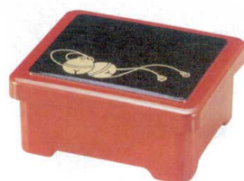
⑫ 1-572-9 A 象足井重 朱パール鈴内朱 ¥1,900 (16.8×14.3×7.6) 柵60