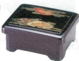
⑨ 1-572-5 A 象足井重 (爪脚付) パール扇面内朱塗 ¥1,800 (16.8×14.3×7.6) 柵60