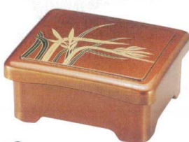
⑤ 1-572-6 A 象足井重 (爪脚付) 梨地ラン内朱塗 ¥1,700 (16.8×14.3×7.6) 柵60