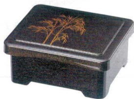
④ U-1-21 A 象足井重 梨地竹内朱塗 ¥1,700 (16.8×14.3×7.6) 柵60