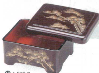
⑩ 1-572-7 A 象足井重 (爪脚付) 溜老松内朱塗 (身・蓋柄入) ¥1,900 (16.8×14.3×7.6) 柵60