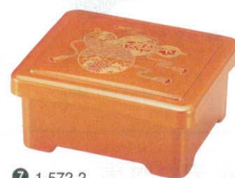
⑦ 1-572-2 A 象足井重 金パールひさご内朱 ¥1,750 (16.8×14.3×7.6) 柵60