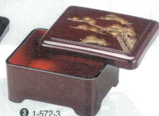
③ 1-572-3 A 象足井重 (爪脚付) 溜老松内朱塗 (蓋のみ柄入) ¥1,650 (16.8×14.3×7.6) 柵60