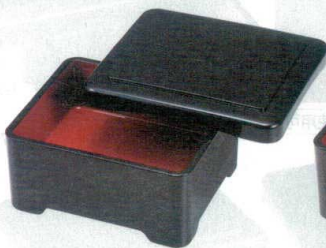
① U-1-75 A 象足井重 黒内朱塗 ¥1,500 (16.8×14.3×7.6) 柵60