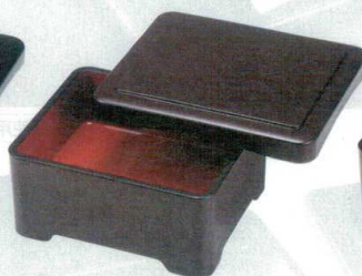
② U-1-76 A 象足井重 艶消新溜内朱塗 ¥1,550 (16.8×14.3×7.6) 柵60