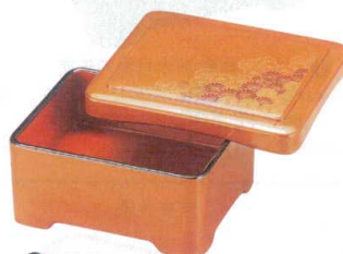
⑥ 1-572-1 A 象足井重 野菊内朱 ¥1,750 (16.8×14.3×7.6) 柵60