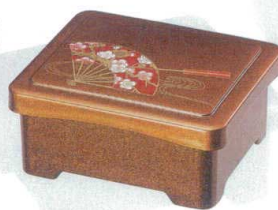
⑭ U-1-22 A 象足井重 梨地新扇面内朱塗 ¥2,000 (16.8×14.3×7.6) 柵60