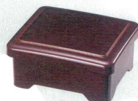
⑮ U-1-20 A 象足井重 溜内朱塗 S・S塗 ¥2,600 (16.8×14.3×7.6) 柵60