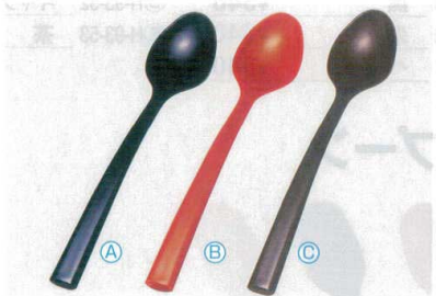
5 AC コーヒースプーン (13.4×2.4) 梱1000 A 1-772-7 黒 ¥280 B 1-772-8 朱 ¥280 C H-59-57 溜塗 ¥430