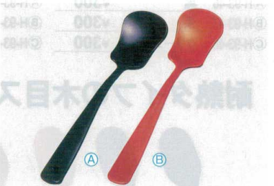
6 AC アイスクリームスプーン (13.7×2.9) 梱1000 A 1-772-17 黒 ¥270 B 1-772-18 朱 ¥270