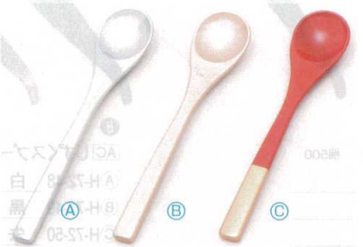
9 A 茶碗蒸しスプーン (13.1×2.7) 梱1000 A H-59-58 銀塗 ¥400 B H-59-59 シャンパンゴールド ¥450 C H-59-60 朱/金塗り分け ¥480