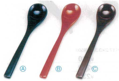
8 A 茶碗蒸しスプーン (13.1×2.7) 梱1000 A 1-772-13 黒塗 ¥300 B 1-772-14 朱塗 ¥300 C H-9-37 溜塗 ¥320