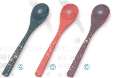
10 A 茶碗蒸しスプーン (13.1×2.7) 梱1000 A H-59-61 黒色紙金箔 ¥650 B H-59-62 朱色紙金箔 ¥650 C H-59-63 溜色紙金箔 ¥670