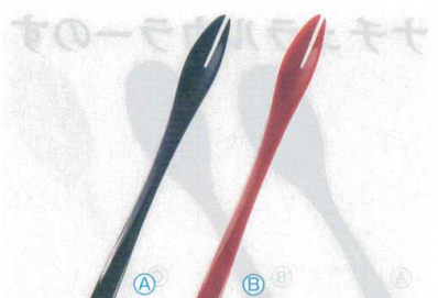
3 AC フォーク(大) (15×1.5) A H-69-51 黒 ¥250 B H-69-52 朱 ¥250