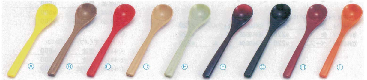
7 茶碗蒸しスプーン (13.1×2.7) 梱1000 A 1-772-39 A イエロー ¥185 B 1-772-40 A グレー ¥185 C 1-772-41 A 赤 ¥130