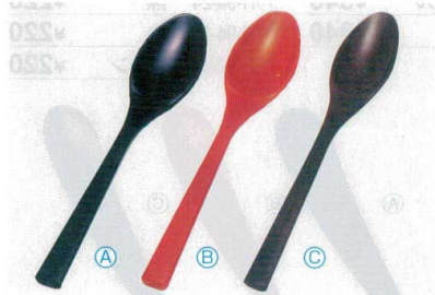
4 AC デザートスプーン (11×2) 梱1000 A 1-772-5 黒 ¥250 B 1-772-6 朱 ¥250 C H-59-56 溜塗 ¥410