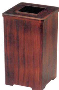
9 H-35-46 [A]角くず入れ 新紫檀塗 ¥6,000 (21×21×36) 櫃6