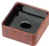
3 H-35-39 [M]ティーパック入れ 新紫檀塗 ¥1,200 (7.9×7.9×3.6) 櫃100