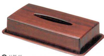
5 H-35-44 [A] (小)ティッシュボックス(浅型) 新紫檀塗 ¥3,500 (29.8×16.5×6.3) 櫃20