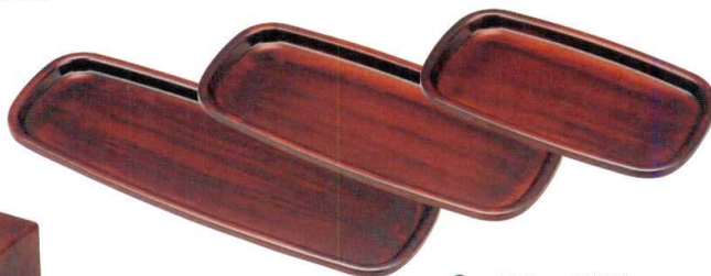
7 [M]小判トレー 新紫檀塗 H-35-41 (小) ¥1,650 (22.4×12.2×1.7) 櫃140 H-35-42 (中) ¥2,000 (28.3×12.6×1.7) 櫃120 H-35-43 (大) ¥2,500 (34.2×13×1.7) 櫃100