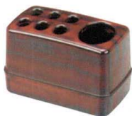
2 H-35-38 [A]歯ブラシ立て 新紫檀塗 ¥2,100 (13.9×7.7×9) 櫃40