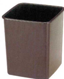
13 [A]角ダストボックス マロン 1-810-3 (小) ¥2,200 (18.4×18.4×21.8) 櫃20 1-810-4 (大) ¥3,150 (21.4×21.4×26) 櫃10