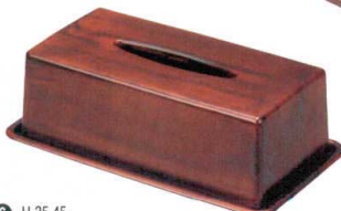
6 H-35-45 [A] (大)ティッシュボックス(深型) 新紫檀塗 ¥4,200 (30.8×17.5×10.3) 櫃20