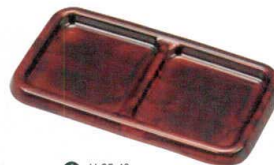
4 H-35-40 [M]ニツ仕切ティーパックトレー 新紫檀塗 ¥1,450 (19.5×10.5×1.7) 櫃100