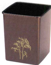
15 [A]角ダストボックス 梨地竹 1-810-9 (小) ¥2,800 (18.4×18.4×21.8) 櫃20 1-810-10 (大) ¥3,900 (21.4×21.4×26) 櫃10