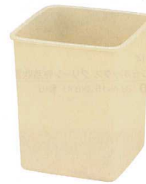
16 [A]角ダストボックス アイボリー 1-810-7 (小) ¥2,600 (18.4×18.4×21.8) 櫃20 1-810-8 (大) ¥3,800 (21.4×21.4×26) 櫃10