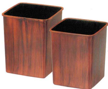
8 [A]角ダストボックス 新紫檀塗 H-35-47 (小) ¥3,300 (18.4×18.4×21.8) 櫃20 H-35-48 (大) ¥4,500 (21.4×21.4×26) 櫃10