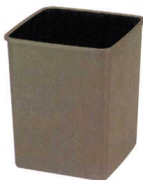
14 [A]角ダストボックス グレー乾漆 1-810-5 (小) ¥2,200 (18.4×18.4×21.8) 櫃20 1-810-6 (大) ¥3,150 (21.4×21.4×26) 櫃10