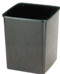
12 [A]角ダストボックス 黒 1-810-1 (小) ¥2,200 (18.4×18.4×21.8) 櫃20 1-810-2 (大) ¥3,150 (21.4×21.4×26) 櫃10