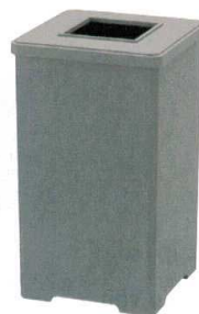
10 1-810-27 [A]角くず入れ グレークロス ¥4,800 (21×21×36) 櫃6