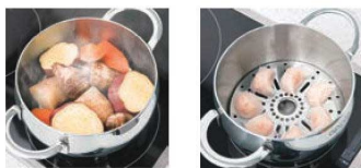
⑧スティームスタンド