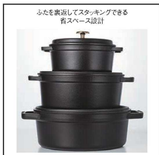
ふたを裏返してスタッキングできる 省スペース設計