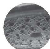
調理中のふた裏の様子 (イメージ)

ふた裏の丸突起「ピコ」が食材から出る水蒸気を 水滴にして食材に落とします。その循環システムは 調理の間中たえず続くので無水料理も可能です。