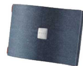
⑦ ジーンズ (A4横)