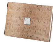
④ ナチュラル (A4横)