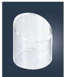
⑧EBM アクリル 伝票立