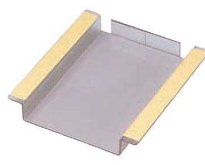
⑳伝票ホルダー受け