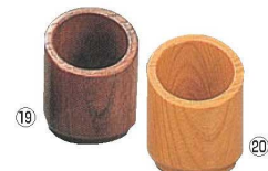
ウッドウィン丸チェクスタンド