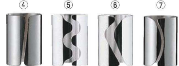
UK 18-8 伝票立