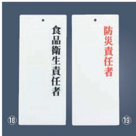
えいむ アクリルプレート