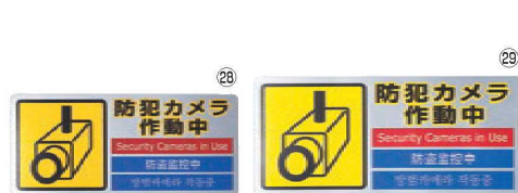
多国語防犯対策ステッカー