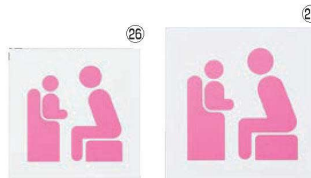
ベビーチェアマーク