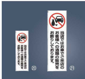
飲酒運転禁止 プレート