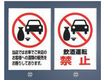
飲酒運転禁止 プレート