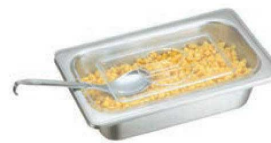
⑦ ポリカーボネイト ホテルパン蓋 PNCタイプ ●ポリカーボネイトで耐久性に優れています。 ●耐熱温度(-45℃~120℃)