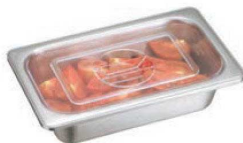
⑥ ポリカーボネイト ホテルパン蓋PCタイプ ●ポリカーボネイトで耐久性に優れています。 ●耐熱温度(-45℃~120℃)