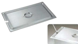
③ 18-8 ホテルパン蓋NC型 (レードル用切込穴付)