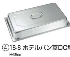
④ 18-8 ホテルパン蓋DC型 H65mm