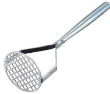
①EBM 18-8 パイプ柄ポテトマッシャー ページコード 商品コード 価格 大 2-0497-0101 φ100×H335 1580300 ¥4,200 小 2-0497-0102 φ 80×H305 1580400 ¥4,000 穴の大きさ:8×8 ●オールステンレスで衛生的です。