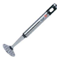
⑫ツヴィリング ミニマッシャー 71 ページコード 商品コード 価格 39752 2-0497-1201 5568820 ¥1,700 全長:180 φ45 材質:ステンレス 穴径:φ5 ●小さな器の中でも食材を細かく潰せます。