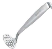
⑬TS 18-8 ミニマッシャー ページコード 商品コード 価格 2-0497-1301 0696010 ¥970 外寸:47×43×165 穴の大きさ:5×5 ●少量に便利なミニサイズ ●他の使用方法として卵の攪拌もスピーディーに行えます。