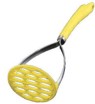
⑧シリコンポテトマッシャー 71 ページコード 商品コード 価格 イエロー 2-0497-0801 4213200 ¥1,800 外寸:100×88×H290 耐熱温度:220℃ 穴の大きさ:23×7 ●レンジがつかせて、しかも離れがよい。 力の入りやすい大判サイズ