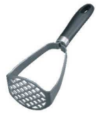
⑥ポテトマッシャー 71 71 ページコード 商品コード 価格 AL-18 2-0497-0601 5841800 ¥2,100 外寸:φ80×235 穴の大きさ:7×7