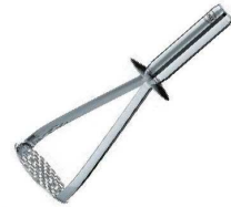
②18-10 レズレー ポテトマッシャー 71 ページコード 商品コード 価格 12780 2-0497-0201 5200500 ¥6,000 全長:260 φ90 穴径:φ7