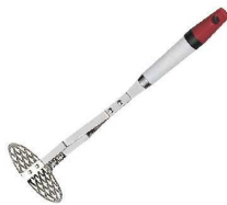
⑤メインコック ポテトマッシャー 71 ページコード 商品コード 価格 No522 2-0497-0501 4923130 ¥600 外寸:φ80×H260 穴の大きさ:7×7 材質:18-0ステンレス、ナイロン樹脂 ●ジャガイモ等の調理に最適です。