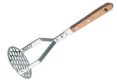
④パッカーウッド木柄 ポテトマッシャー 71 ページコード 商品コード 価格 2-0497-0401 0696900 ¥770 外寸:φ80×H250 穴の大きさ:7×7