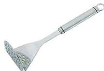
⑨18-8 マッシャー (9921-076) ページコード 商品コード 価格 2-0497-0901 2797500 ¥1,900 全長:273 頭部:83×75