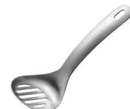
⑪18-0 マッシャースプーン 71 ページコード 商品コード 価格 TF1 2-0497-1101 1171600 ¥1,200 外寸:幅61×全長180 ●つぶす、混ぜる、盛り付けるが一本でできる スプーン型ポテトマッシャーです。