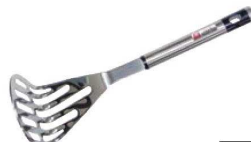
⑩ツヴィリング ポテトマッシャー L型 71 ページコード 商品コード 価格 39759 2-0497-1001 5568810 ¥2,200 外寸:幅80×全長240 材質:ステンレス