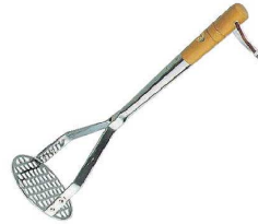
③リス 木柄 業務用 ポテトマッシャー ページコード 商品コード 価格 大 2-0497-0301 φ100×H335 0696500 ¥2,500 小 2-0497-0302 φ 80×H305 0696600 ¥2,300 穴の大きさ:8×8