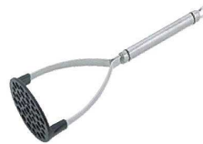
⑦18-8 ナイロンマッシャー (9934-360) ページコード 商品コード 価格 2-0497-0701 2798300 ¥1,500 全長:274 頭部:φ86