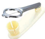
⑰玉子切器 縦型 (2分割 1本線)