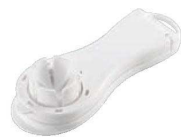
⑱縦切りエッグカッター