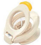
⑮エッグスライサー