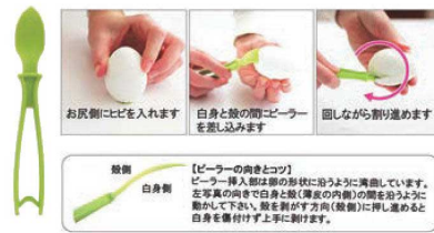
㉑リンデンヨナス PP エッグピーラー