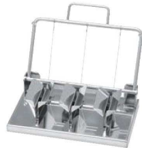
⑫18-8 縦割三連 エッグカッター