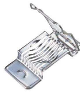
⑬玉子切器 ステンレス (8本線)