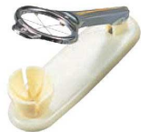
⑯玉子切器 縦型 (6分割)