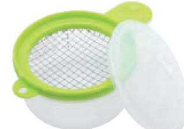
㉕サンドイッチ用 玉子メーカー