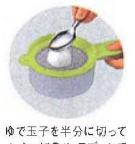
ゆで玉子を半分に切って メッシュにのせ、スプーンで 裏ごしします