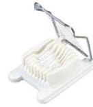
⑭玉子切器 PC台 (8本線)