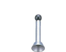
㉒LT 18-10 エッグトップカッター