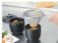
茶碗蒸し作りでとき卵がきれいにこせ、まろやかさアップ