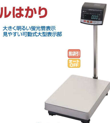
②イシダ 電子質量台はかり