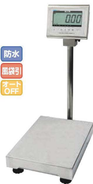
④ヤマト 防水型デジタル台はかり