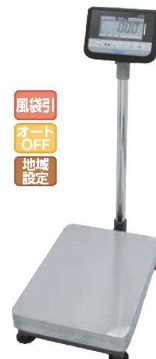
⑤ヤマト デジタル台はかり