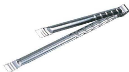
⑧ ステンレス 火バサミ