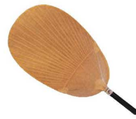
⑥ 洗うちわ (小判)

全長:約300 ●煙だけでなく地鳥などをワイルドに焼く事もできますので、演出効果も抜群です。 ●菜園の敷わら、雑草などにも最適です。 ※色やサイズなどは自然のもので不揃いですがあらかじめご了承ください。