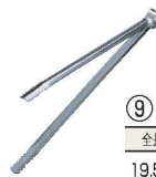
⑨ 18-0 炭バサミ