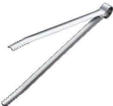
⑪ エコクリーン 18-0 厚口炭バサミ