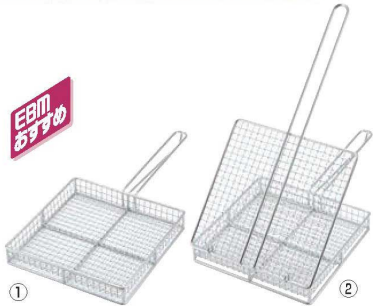
① EBM 18-8 炭火やきとりカゴ