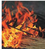
⑤ 国産わら フラ焼き用 (約500g×20袋入)