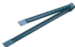
⑦ 鉄 火バサミ