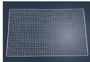
④ キャンピングロースター