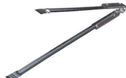
⑫ 18-0 木柄付 火バサミ