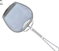
⑧18-8 プレス式 角型 カス揚 細目

●金網部分を板金で巻き締めし、中に全周芯金を入れてありますので、使用中に網が切れたり外れたりしにくい構造になっています。