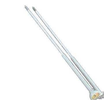
⑯アルミ 温度計付 揚箸 天ぷらメーター