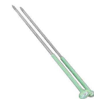
⑰ステンレス 温度計付 揚箸 天ぷらメーター