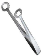
⑪ステンレス ロング天ぷらトング