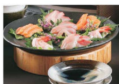
▶ P1126 丸太ディスプレイ台