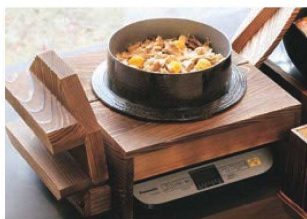
▶ P1124 電磁調理器用ごはん釜