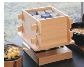
▶ P913 角セイロ ▶ P1123 EBM IH調理器用木枠