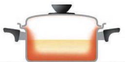
全面多層構造のビタクラフト 側面にも効率よく熱が伝導