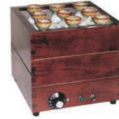
③ 電気爛どうこ かんすけ ㊦

ページコード 商品コード 価格 2-1087-0201 3126000 ¥9,000 外寸:284×229×H255 材質:桧杉 ●HS-8Nにかぶせるだけで、簡単にセットできます。