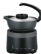
⑧ 酒爛器 ㊦

ページコード 商品コード 価格 2-1087-0701 1093310 ¥27,000 チロリ外寸:85×150×H173 360cc 本体外寸:135×135×H155 重量:2kg 材質:本体/天然木・陶器 チロリ/錫 ●陶器にお湯を入れ、チロリをセットするだけで簡単に爛ができます。 ●爛温度は陶器の中のお湯の量だけで決まり、そのままキープ ●電気・ガス不要・爛が早い(90秒/1合)