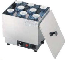
① タイジ 電気爛どうこ ㊦

ページコード 商品コード 価格 HS-8N 2-1087-0101 3134300 ¥48,000 内寸:249×194×H170 電源:100V 50/60Hz 消費電力:500W 取容量:1合鉢子 12本 / 2合鉢子 8本 温度調節:可変式サーモスタット 標準温度30~90℃ 重量:6kg 付属品:スノコ、ピンキャップ、フタ、デジタル酒温度計各1