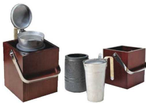
⑦ 卓上酒爛器 ミニかんすけ 匠 ㊦

ページコード 商品コード 価格 2-1087-0701 1093310 ¥27,000 チロリ外寸:85×150×H173 360cc 本体外寸:135×135×H155 重量:2kg 材質:本体/天然木・陶器 チロリ/錫 ●陶器にお湯を入れ、チロリをセットするだけで簡単に爛ができます。 ●爛温度は陶器の中のお湯の量だけで決まり、そのままキープ ●電気・ガス不要・爛が早い(90秒/1合)