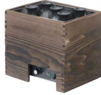
② タイジ 電気爛どうこ HS-8N用木枠 ㊦

ページコード 商品コード 価格 HS-8N 2-1087-0101 3134300 ¥48,000 内寸:249×194×H170 電源:100V 50/60Hz 消費電力:500W 取容量:1合鉢子 12本 / 2合鉢子 8本 温度調節:可変式サーモスタット 標準温度30~90℃ 重量:6kg 付属品:スノコ、ピンキャップ、フタ、デジタル酒温度計各1