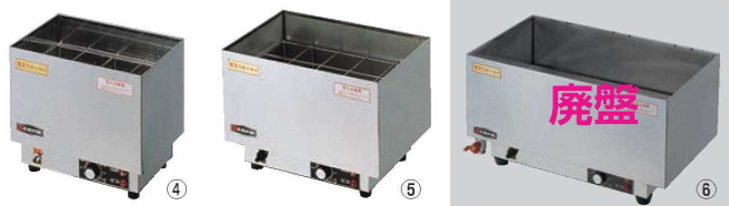
エイシン 電気 爛ドーコ ㊦

ページコード 商品コード 価格 TK-4型 2-1087-0301 1093400 ¥45,000 外寸:260×260×H260 水槽内寸:215×215×H115 (1合徳利8~9本) 温度:30℃~90℃(可変サーモ) 電源:100V 消費電力:1kW ※酒タンボは別売りです。