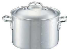
②ニューキング アルミ 半寸胴鍋 (目盛付)