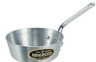
⑥ニューキング アルミ テーパー鍋 (目盛付)