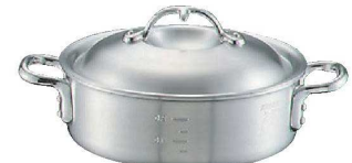
③ニューキング アルミ 外輪鍋 (目盛付)