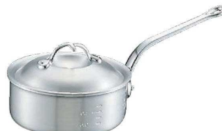
⑤ニューキング アルミ 浅型 片手鍋 (目盛付)