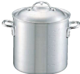
①ニューキング アルミ 寸胴鍋 (目盛付)