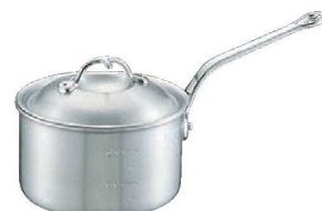
④ニューキング アルミ 深型 片手鍋 (目盛付)