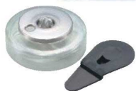
② ヒートエースα スタンダード ロータイプ