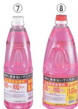
暖暖(保温用液体燃料)