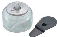
① ヒートエースα スタンダード 6H

③ 専用漏斗を使って燃料を補充します。(補充キャップをお使いいただくと便利です。)