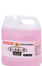
⑥ ヒートエースマックス 詰替専用 液体燃料 4ℓ 71