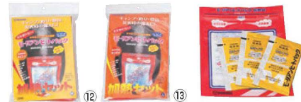
モーリアン ヒートパック ハイパワー 加熱セット 93