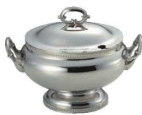
⑤SW 18-8 菊測 小判 スープチューリン