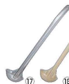
カーライル カーリーレードル 0295 小