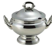
⑧SW 18-8 B測 丸 スープチューリン