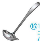
⑯18-8 ニューライラック パンチレードル