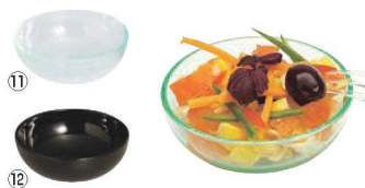
⑪⑫ ミニサラダボール 50ml (50入)