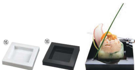
⑮⑯ ミニヨン (360入)