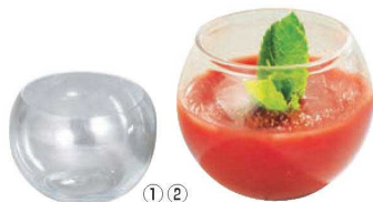
①② スフェア クリア (5入)