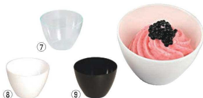
⑦⑧⑨ ミニボール 30ml (50入)