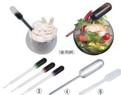
③④⑤ ビベット (100入) クリア