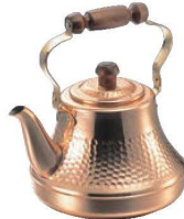
⑦銅 クラッシー ケトル 容量 2.0ℓ ベージコード 2-1281-0701 外形 195 口径 85 深さ 155 商品コード 8034800 価格 ¥14,700 2.5ℓ ベージコード 2-1281-0702 外形 195 口径 85 深さ 170 商品コード 8034900 価格 ¥15,200