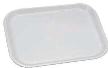
⑩ベリートレー 長角 洗