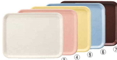
長角トレー AP-440 洗