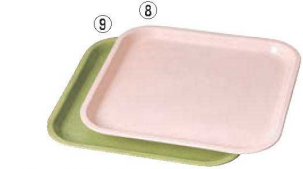
ハードトレー 正角 31cm HD4108 洗