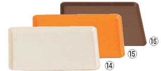
PP セルフトレー 106Z