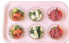
⑲FRP プリセットトレー 洗