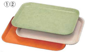
①ハードトレー 長角 大 HD-106D 洗