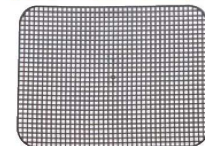
⑱トラエックス アンチスキッド トレーマット 長角 洗