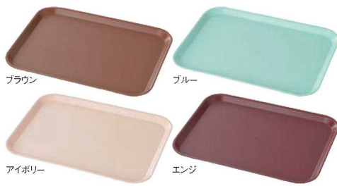
⑰PPトレー 長角 6106 大