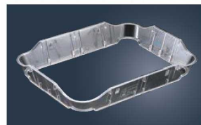
⑳トレースタッカー 洗