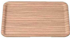
⑤ 木目調ABSユニバーサルトレー ゼブラウッド NS