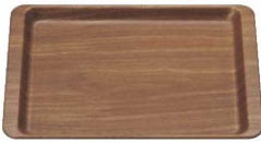
④ 木目調ABSトレー 長角盆 濃木目 NS