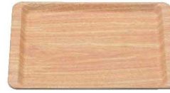
③ 木目調ABSトレー 長角盆 薄木目 NS