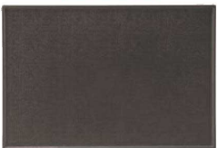
⑬ 長角盆 黒NS