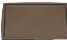
⑨ PP長角盆 ブラウン