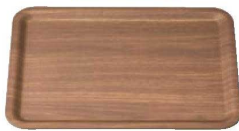
⑧ 木目調ABSユニバーサルトレー 濃木目 NS