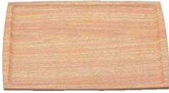
① 木目調ABSトレー 長角盆 薄木目 NS