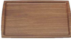
② 木目調ABSトレー 長角盆 濃木目 NS