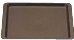
⑩ PP長角盆 ブラウン