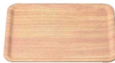
⑦ 木目調ABSユニバーサルトレー 薄木目 NS