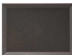
⑫ 長角盆 黒NS