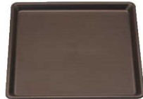
⑪ PP正角盆 ブラウン