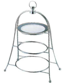
④UK 18-8 アフタヌーンティー スタンド 3サイズ用