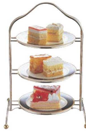
③UK 18-8 アフタヌーンティー スタンド