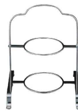
⑩ミスタースリム 18-8 ハイティースタンド 2段 MR-415 加