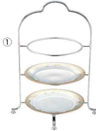
①UK 18-8 3段 ハイティースタンド