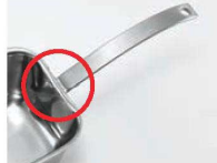
ハンドルが本体に隙間なく溶接されているので異物混入の心配がありません。