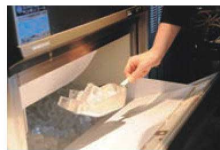
水だけでなく、粉物にも最適です。