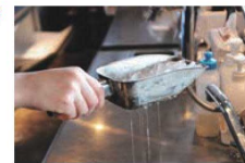
穴のおかげでスムーズに水が切れ、水のみを簡単にすくう事が出来ます。