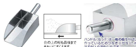
台の上の粉も最後まできれいにすくえます。