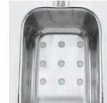
8mmの穴が9カ所開いています。