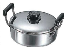
⑨MA 18-0 浅型 ソースポット