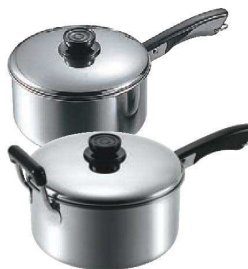
⑩MA 18-0 深型 ソースパン