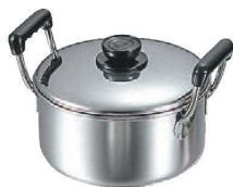
⑧MA 18-0 深型 ソースポット