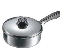
⑪MA 18-0 浅型 ソースパン