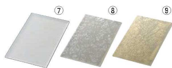
レクタングルプレート 取替 洗