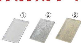
スリムレクタングルプレートM 取替 洗