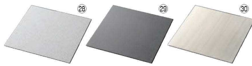
スクウェアプレートL 取替 洗