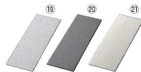
スリムレクタングルプレートL 取替 洗