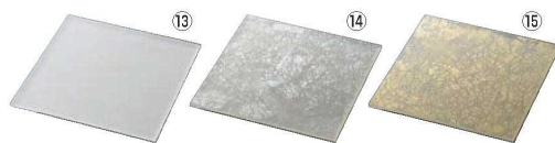
スクウェアプレートL 取替 洗