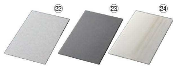
レクタングルプレート 取替 洗