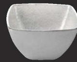
③ 錫 小鉢 四角 501030 ㊚ ページコード 商品コード 価格 2-1628-0301 5927600 ¥5,500 外寸:93×93×H53