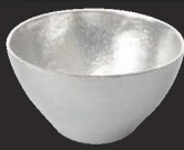
① 錫 小鉢 丸 501010 ㊚ ページコード 商品コード 価格 2-1628-0101 5927400 ¥5,500 外寸:φ100×H53