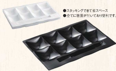
③「和」テイスト ビュッフェプレート 黒 ㊦