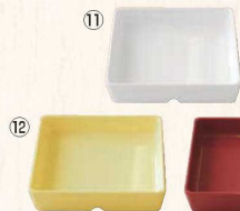
スクエアパーツ・ポーション 4/9 M-2394 ㊦