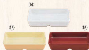
スクエアパーツ・ポーション 2/9 M-2392 ㊦