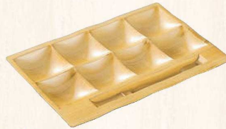
④「和」テイスト ビュッフェプレート 白木(刷毛目) ㊦