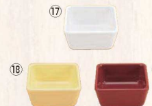
スクエアパーツ・ポーション 1/9 M-2391 ㊦