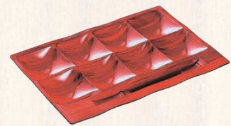
⑤「和」テイスト ビュッフェプレート 赤茶(刷毛目) ㊦