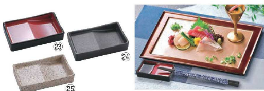
ABS 箸置付長角醤油皿