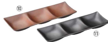
スリーブプレート