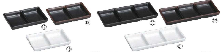
耐熱いぶし釉 2点珍味皿