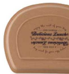
ライトブラウン 蓋