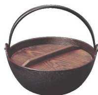
⑨トキワ鉄 電磁 やまが鍋 423 21cm 切