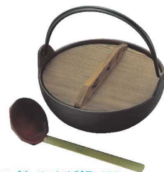
③トキワ鉄 やまが鍋 401 切