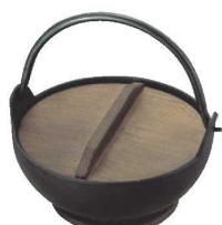
④トキワ鉄 やまが鍋 413 切