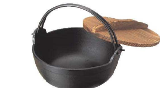
①南部鉄 黒塗り ふる里鍋 深型 切

鍋は日本人のこころの故郷。鉄器が醸し出すやさしい風合いは、 人のぬくもりにも似て宴をいっそうあたたかなものにします。