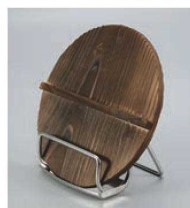
⑩EBM 18-8 なべ蓋スタンド 切