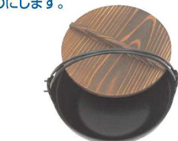
②南部鉄 黒塗り ふる里鍋 切