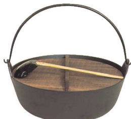
⑧五進鉄 ジャンボ 田舎鍋 切

※内面ホーロー仕上 ※15~21cmは、電磁調理器にご使用できません。 ※15cmに杓子は付属されていません。 ※18cm~33cmに敷板は付属されていません。