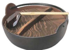
⑦五進鉄 田舎鍋 切

※16-18cmは、電磁調理器にご使用できません。 ●内面加工がされていない為、鉄分の補給に効果的です。