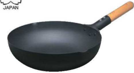
③マグマプレート匠 炒め鍋