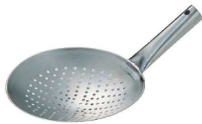
⑦EBM ステンレス 中華 穴明 片手鍋