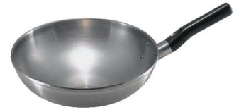
⑥ロイヤル 中華鍋 HCD-330