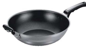
⑤フジ IH 中華鍋 DX