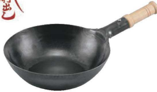
②山田 鉄木柄中華片手鍋 底平型 IH用 (板厚2.3mm)