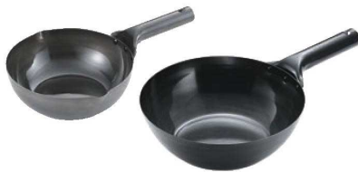
④IH 鉄 北京鍋