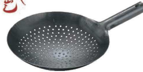
⑧山田 鉄 打出 中華 穴明 片手鍋